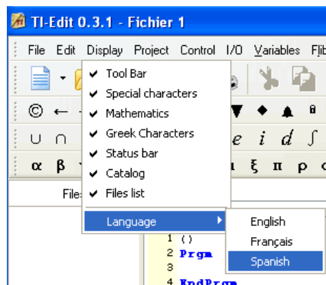
Figura 2 Selección de Idioma